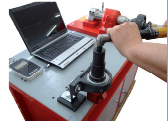
Moderne Drehmomentmesstechnik im Einsatz

Wir sind bestens für Ihre Anforderungen ausgerüstet: